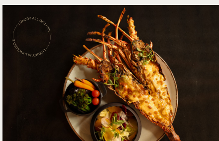
Мальдивский Лобстер Термидор