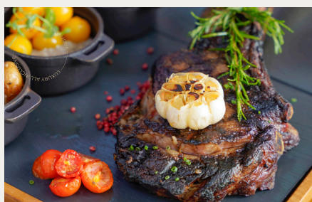
Стейк томагавк 1 – 1,2 кг из австралийской говядины Стокьярд Голд Ангус