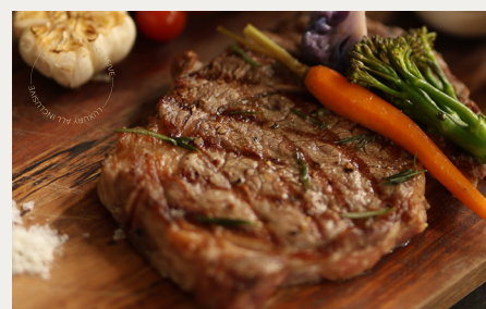
Говядина Вагю мраморностью 8-9